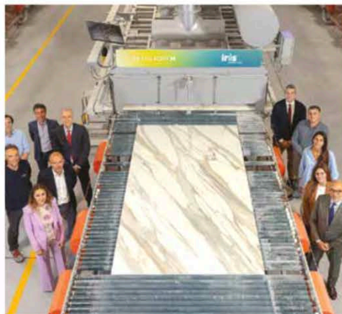
A sinistra, un esempio di impegno per la biodiversità. A destra, una lastra di Iris Ceramica ed Edison Next

modulare dell'energia è fondamentale nei progetti a lungo termine, per garantire efficienza e sostenibilità," aggiunge Infante, evidenziando l'importanza di un lavoro sinergico con gli sviluppatori per trovare la soluzione ottimale. Edison sta esplorando anche il potenziale del biometano e dell'idrogeno, sia per il trasporto sia per l'industria, con progetti già operativi o in fase di autorizzazione. Infante osserva inoltre come stia emergendo un cambiamento nel Real Estate, orientato a un concetto di comunità, dove anche l'energia diventa una risorsa condivisa. Edison progetta soluzioni che sfruttano il concetto di scambio di energia tra soggetti diversi, ad esempio attraverso anelli idronici che consentono il teleriscaldamento e il teleraffrescamento, ottimizzando l'utilizzo energetico. "Il nostro approccio innovativo punta a creare valore in una logica di lungo periodo, affrontando le sfide legate alla sostenibilità e all'efficienza energetica," conclude Infante, ribadendo l'importanza di soluzioni integrate e di un dialogo strategico con interlocutori chiave per avviare progetti iconici e collaborazioni strutturate nel settore.